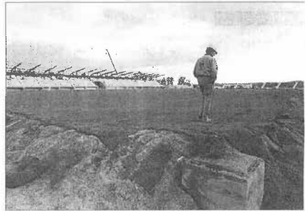
La instalación del césped sobre el nuevo campo de fútbol se efectuó en tan sólo once horas.

El césped del nuevo campo de Puente Castro ya está instalado. En tan sólo 11 horas quedó colocado sobre el firme del estadio que servirá de escenario provisional mientras se construye el 'Nuevo Amilivia' en el Paseo Sáenz de Miera. El césped, de origen holandés, fue situado mediante rollos de 50 metros de largo y 1 metro de ancho. El día 15 será estrenado por la Cultural y el Zaragoza.