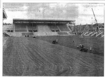
La construcción comenzó a las ocho de la mañana y finalizó a las once de la noche en el estadio de fútbol de 6.000 metros cuadrados de terreno.